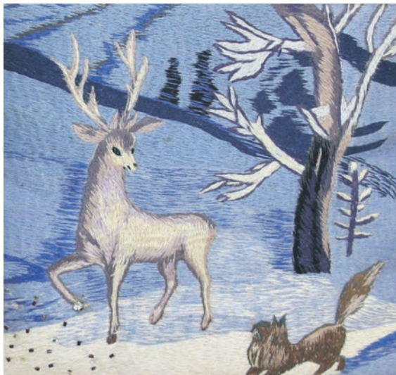
▲ Техника глади требует, чтобы основа была скрыта вышивкой, поэтому автору доступно любое время года