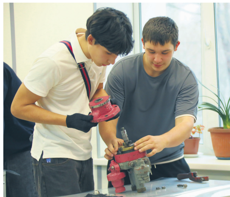
▲ Кран машиниста под своей крышкой таит удивительный мир, который школярам нужно было умело разобрать на детали и собрать обратно

ствует о растущем интересе к проекту. Они тоже получили возможность «пощупать» профессии своими руками и больше узнать о работе Уральской Стали.