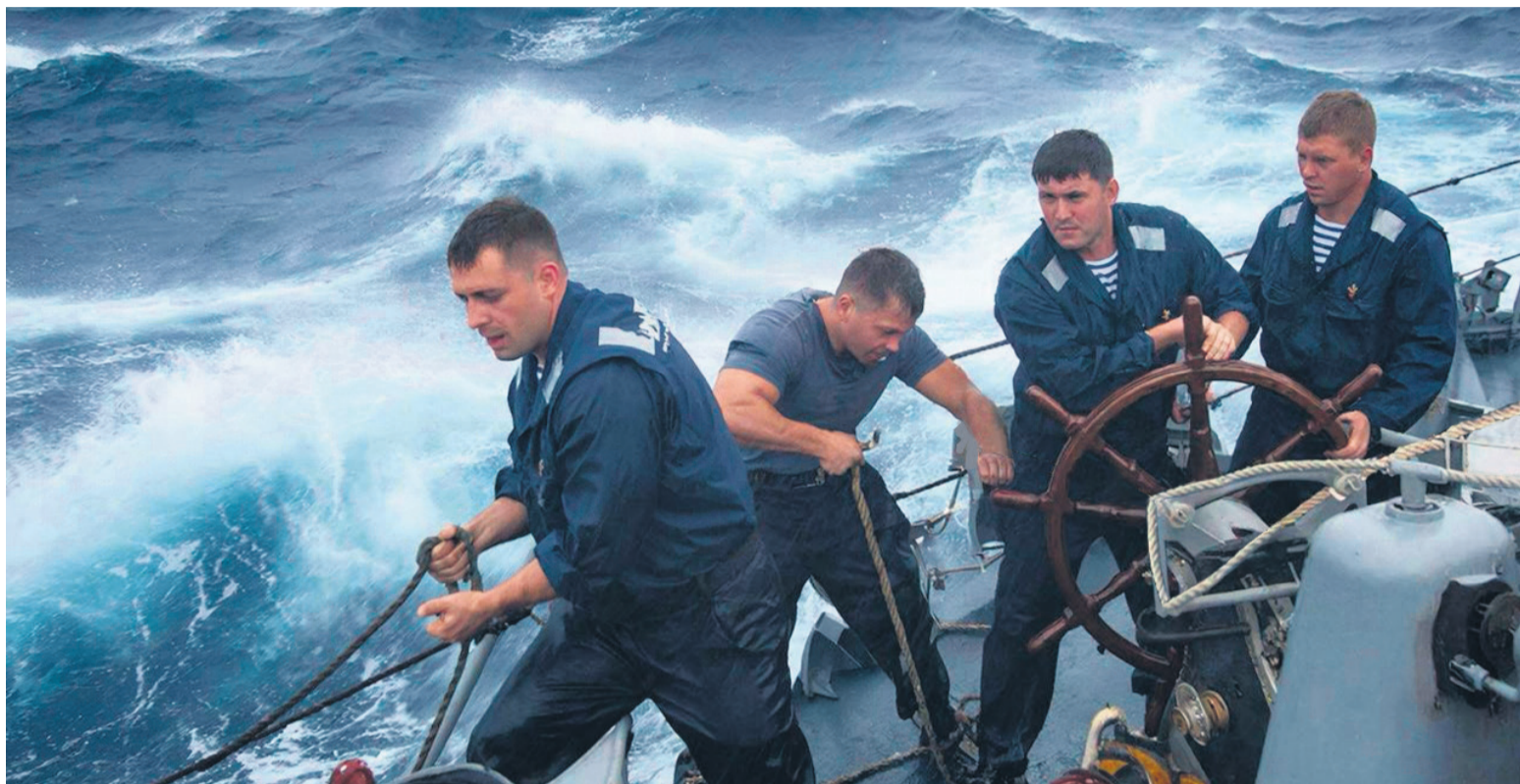
▲ Вклад каждого в слаженную работу всех на общее благо — единственный путь к успеху в ситуации, если ваше судно попало в шторм

Гибкость и скорость: умение быстро менять вектор приложения сил в соответствии с обстановкой.