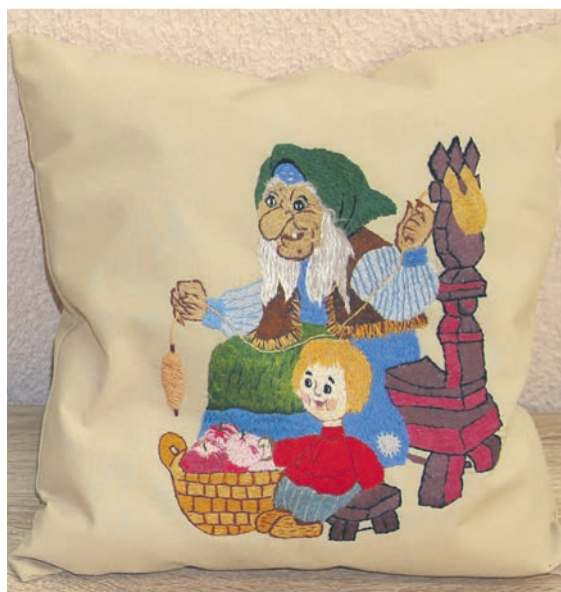
▲ Баба Яга у Титовой, скорее заботливая и трудолюбивая старушка, которой можно даже доверить уход за ребёнком