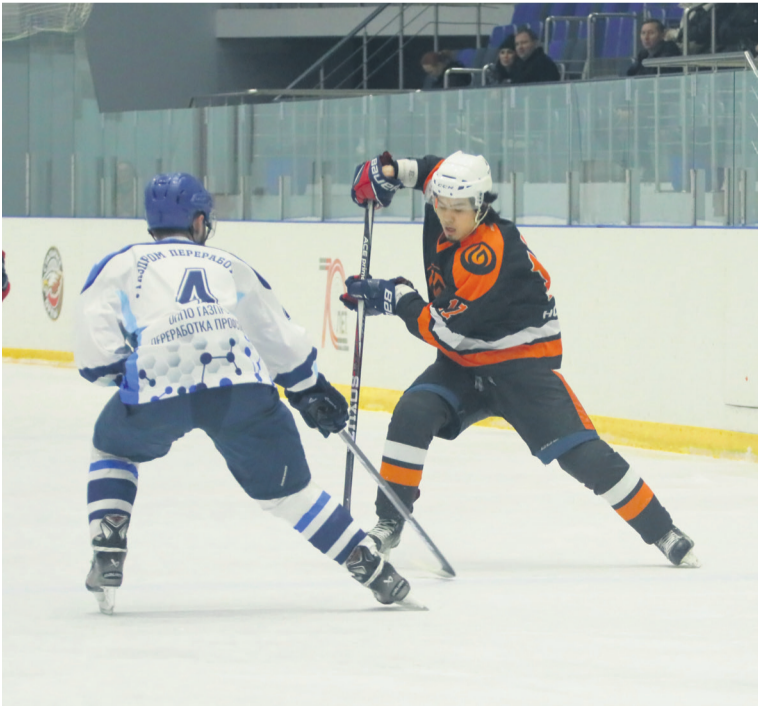
▲ Одно почти незаметное движение клюшкой и соперник не у дел, а дальше — вратарь, против которого «Уральская Сталь» так и не нашла хорошего противоядия

Набрав девять очков, «Уральская Сталь» продолжает лидировать в «регулярке». Следующий матч металлурги тоже проведут дома — 21 декабря они проверят на прочность команду Новосергиевского района.