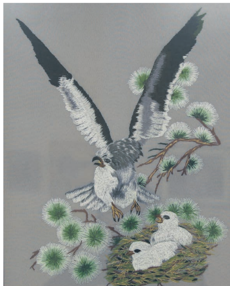
▲ Годы трудов с иглой и нитками подарили зрителям вот такую, почти живую, картину