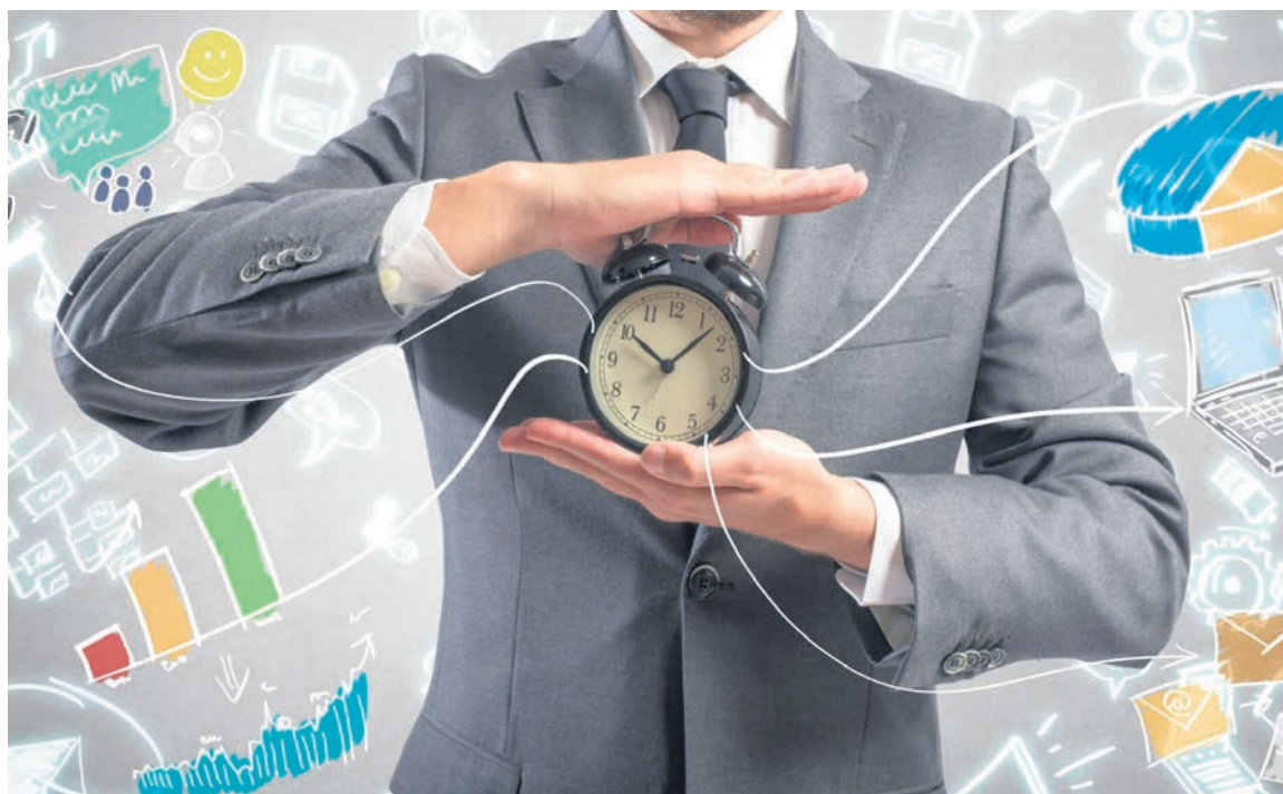
▲ Рабочий день может вмещать разноплановые события: совещания, визиты на объекты и встречи с руководством. Анализ фотографии рабочего времени позволяет убрать из него лишние или повторяющиеся элементы

✓ Обработка собранных данных возможна только после завершения наблюдения, тогда их можно систематизировать без опасений что-то упустить. Такой анализ продемонстрирует показатели