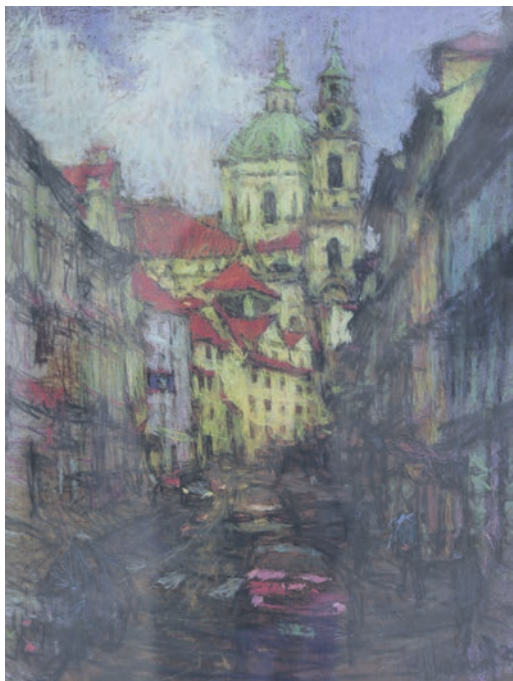
▲ «Пражская улица», бумага, пастель, 2020 год.