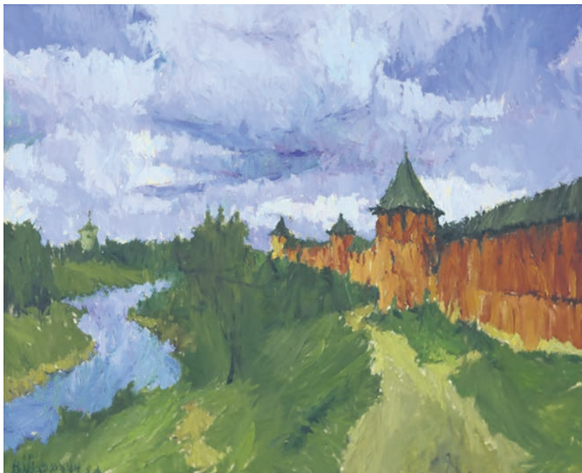
▲ «У стен Кремля», холст, масло, 2025 год.