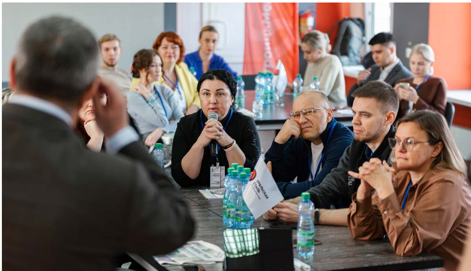
▲ Некоторым докладчикам пришлось непросто: в роли слушателей у них были люди, которые работают «на земле», и не хуже них разбираются в профессии