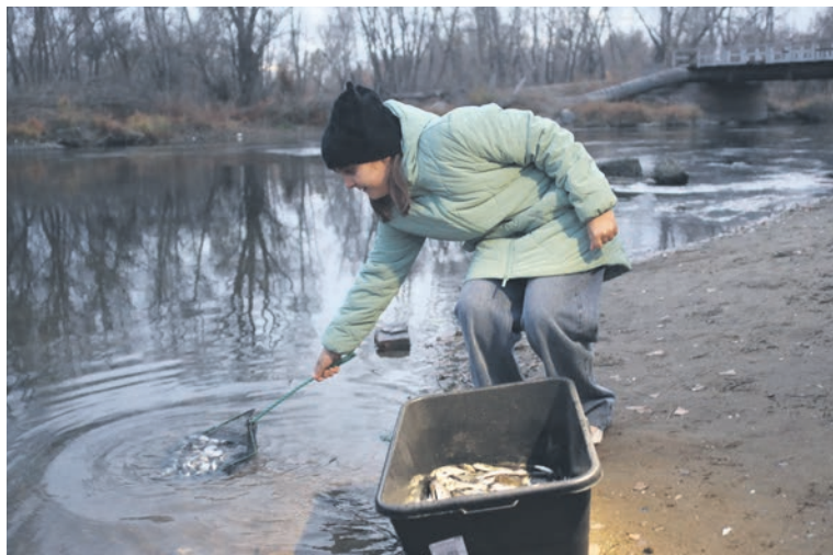
▲ Оказавшись в воде, мальки, словно в раздумье, не спешат уходить от берега, но услышав зов Урала и вильнув хвостом, они уходят на глубину

— Металлурги не ихтиологи, поэтому, для научного подхода, мы согласовываем оптимальную для экосистемы Урала породу рыб со специалистами Росрыболовства и Государственного научного-исследовательского института озёрного и речного хозяйства.