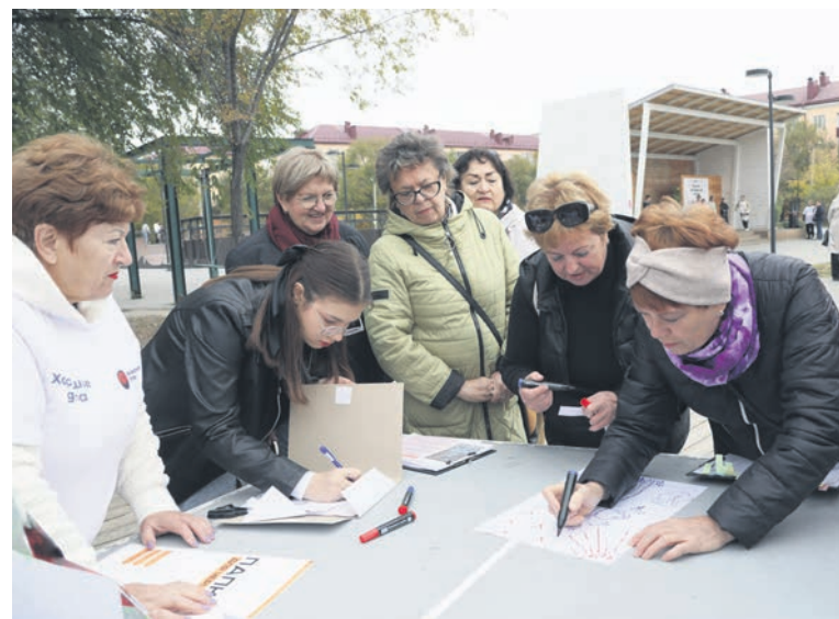
▲ Местом проведения заключительного этапа проекта Совета ветеранов «У старости не старое лицо» был выбран сквер напротив Вечного огня