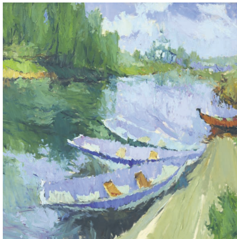
▲ «Лодочная станция», холст, масло, 2025 год.