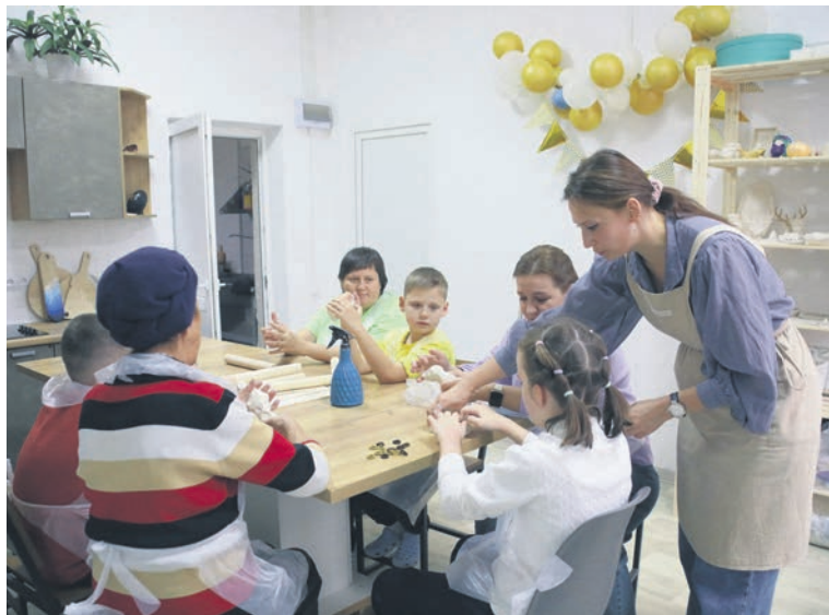
▲ Благодаря компактности группы наставник за полуторачасовое занятие успевает уделить каждому ребёнку столько времени, сколько необходимо