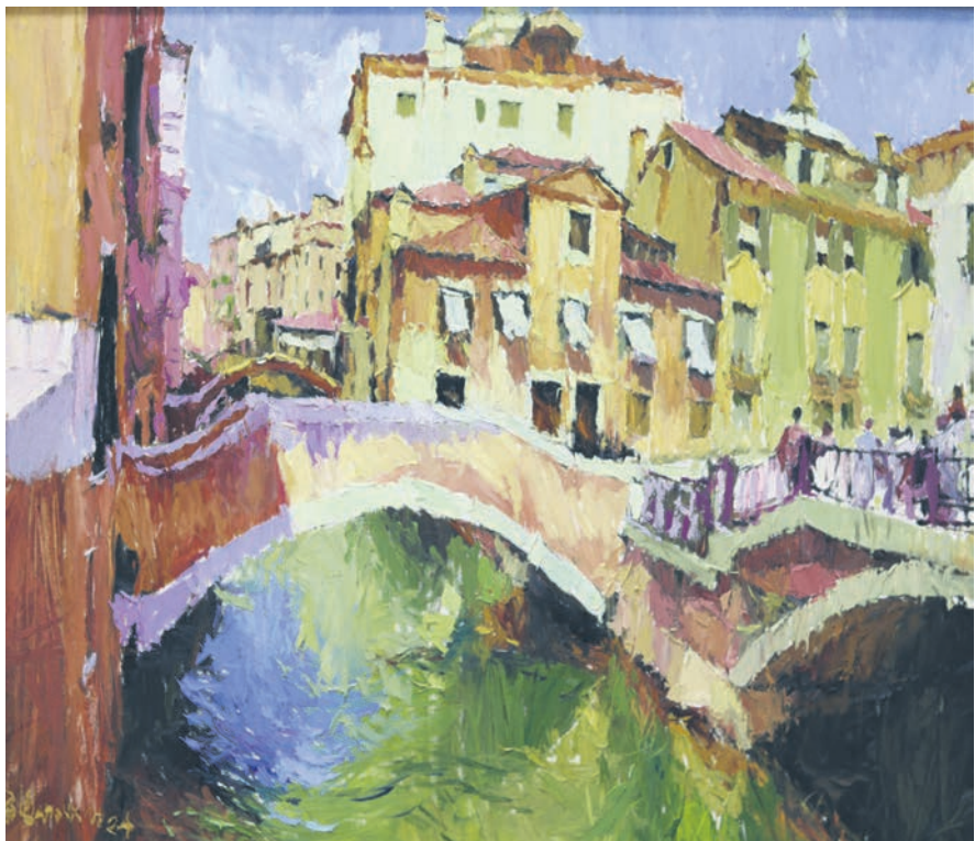
▲ «Мосты», холст, масло, 2024 год.