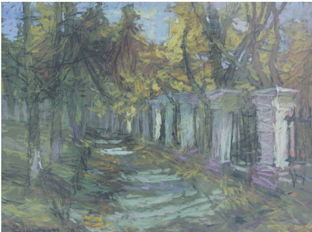
▲ «Ностальгия», бумага, пастель, 2020 год.