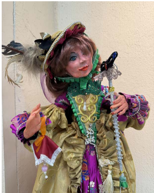
▲ «Дама с маской» скульптора Пугачёвой потребовала некоторого количества полимерной глины и безграничного терпения при отделке