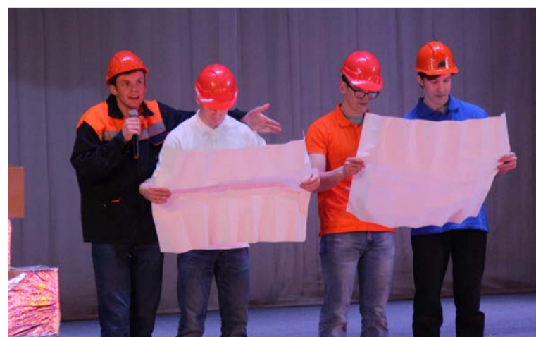
▲ Фрагмент выступления студентов НФ НИТУ МИСИС, которое принесло им первое место в ходе презентации металлургических профессий

НФ НИТУ МИСИС в этом году ждёт специалистов прикладной информатики и механиков. Первые показали свой вариант сказки «Репка», где для роста овоща нужно было собрать схему и подать на неё питание. Жюри, в котором были представители из руководства Уральской Стали, сочли это выступление достойным первого места. Механики вуза поделили серебро с прокатчиками НПК, остальным командам вручили бронзовые награды, почётные грамоты и подарки от комбината. За подготовку студентов отметили и преподавателей учебных заведений.