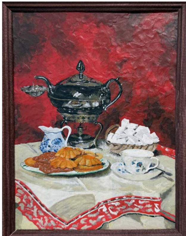
▲ Даже прочитав аннотацию к работе Ирины Чинчаладзе, сложно отделаться от мысли «Не может быть, чтобы это было сделано из пластилина!»