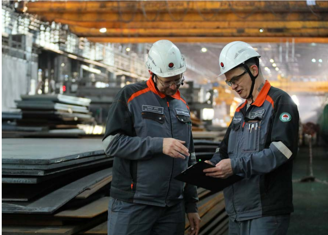
▲ Цикл Деминга включает в себя всё подмножество инструментов развития производства: и обычное планирование, и циклограммы рабочих операций

В 30-х годах прошлого века американский физик и статистик Уолтер Шухарт предложил концепцию непрерывного улучшения процессов через три шага: спецификация, производство, контроль. Позже его идею развил гур у качества Эдвардс Деминг, превративший триаду в квартет «Планируй — Делай — Проверяй — Действуй». В 1950-е годы Деминг обучал этой логике японских промышленников, которые оценили мощь простого алгоритма, верно уловив суть: не спешите с масштабными изменениями, обкатайте гипотезу на локальном участке, потом масштабируйте. Цикл Шухарта-Деминга и сегодня не утерять репутацию золотого