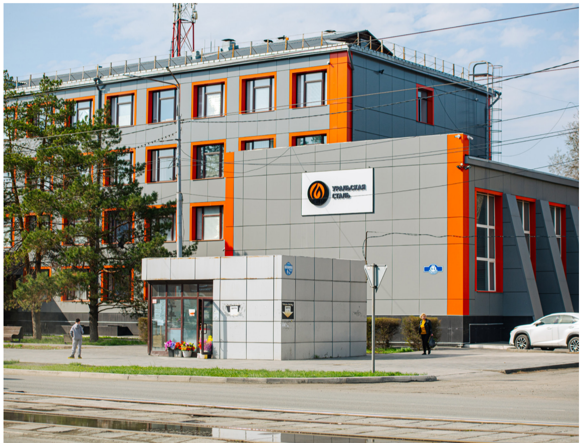
▲ Уральская Сталь за три последних года преобразила здание на улице Советской, в котором с 1964 года металлурги получают новые профессии или повышают квалификацию