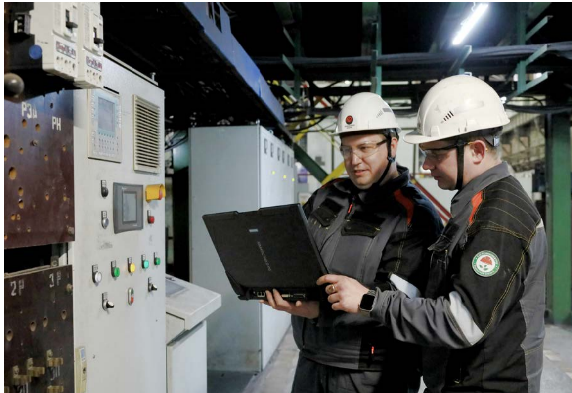
▲ Нетипичные разъёмы на задней панели ноутбука превращают его в программатор, чтобы прямо в цехе можно было корректировать работу оборудования

И помня о её многолетнем опыте, этому веришь, ведь труд инженера Цифровой стали на металлургическом гиганте — это, кроме знания математики и логики производства, ещё и большая ответственность. И такой груз гораздо легче нести, когда есть кому подставить тебе плечо.