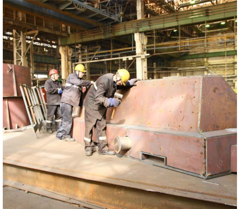
▲ Каждый агрегат, созданный в УПЗЧ, состоит из десятков элементов, собранных профессионалами в единственно верной последовательности

— А вот этот продолговатый узел тоже для аглофабрики? — пройти мимо десятиметровой железяки, напоминающей лежащую сверху килем маленькую подводную лодку, просто невозможно!