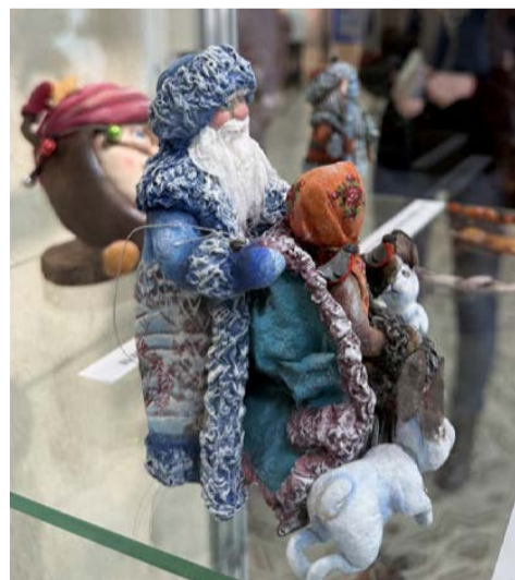
▲ Такой ватный Морозко не дождёт холодом, сидя под ёлкой, а принесёт в дом тепло и ожидание грядущего праздника