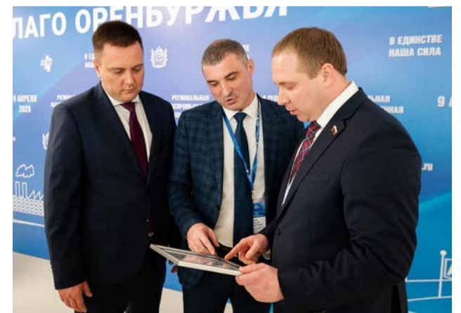
▲ В ходе конференции Уральской Стали вручили свидетельство РСПП на право использования знака «Ответственный бизнес» до марта 2027 года

Конференция в очередной раз стала площадкой для диалога бизнеса и власти, благодаря которой удалось наметить пути решения волнующих общество проблем.