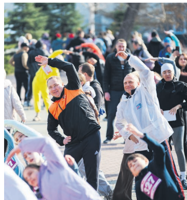
▲ Разминка перед стартом обязательна и для министра спорта, и для директора по социальной политике и корпоративным коммуникациям Уральской Стали