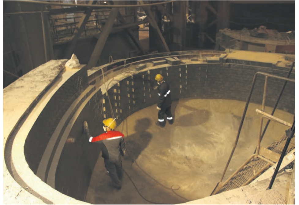
▲ Футеровка рабочего слоя стен ГМП завершена, осталось набить между кирпичей особую сыпучую массу — и печь готова к новым рекордам

Кроме периклазоуглеродистого кирпича, в процессе замены рабочего слоя подины использовались и другие огнеупорные материалы — ремонтные массы для межплавочного обслуживания и ухода за состоянием футеровки печей. С ними экспериментировать не