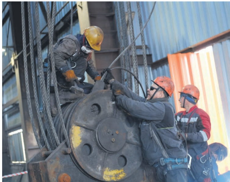
▲ Ремонтная бригада ведёт работы по перепасовке троса полиспастного устройства кантователя ковша

На финишном отрезке капремонта, по словам Леонова, мастера проведут замену кровли и части стенового ограждения из стального профилированного листа.