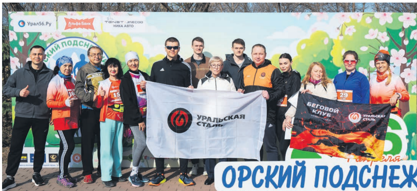
▲ Среди участников Бегового клуба Уральской Стали не только металлурги, вместе на дистанцию выходят люди разных профессий: от продавцов до школьных преподавателей