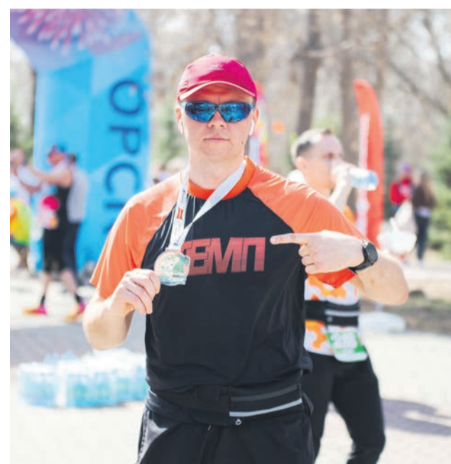
▲ Даже отсутствие призового места способно пополнить коллекцию медалей, которую дают за сам факт финиша

► Те, кто в этот день не вышел на дистанцию, не преминули поддержать бегунов