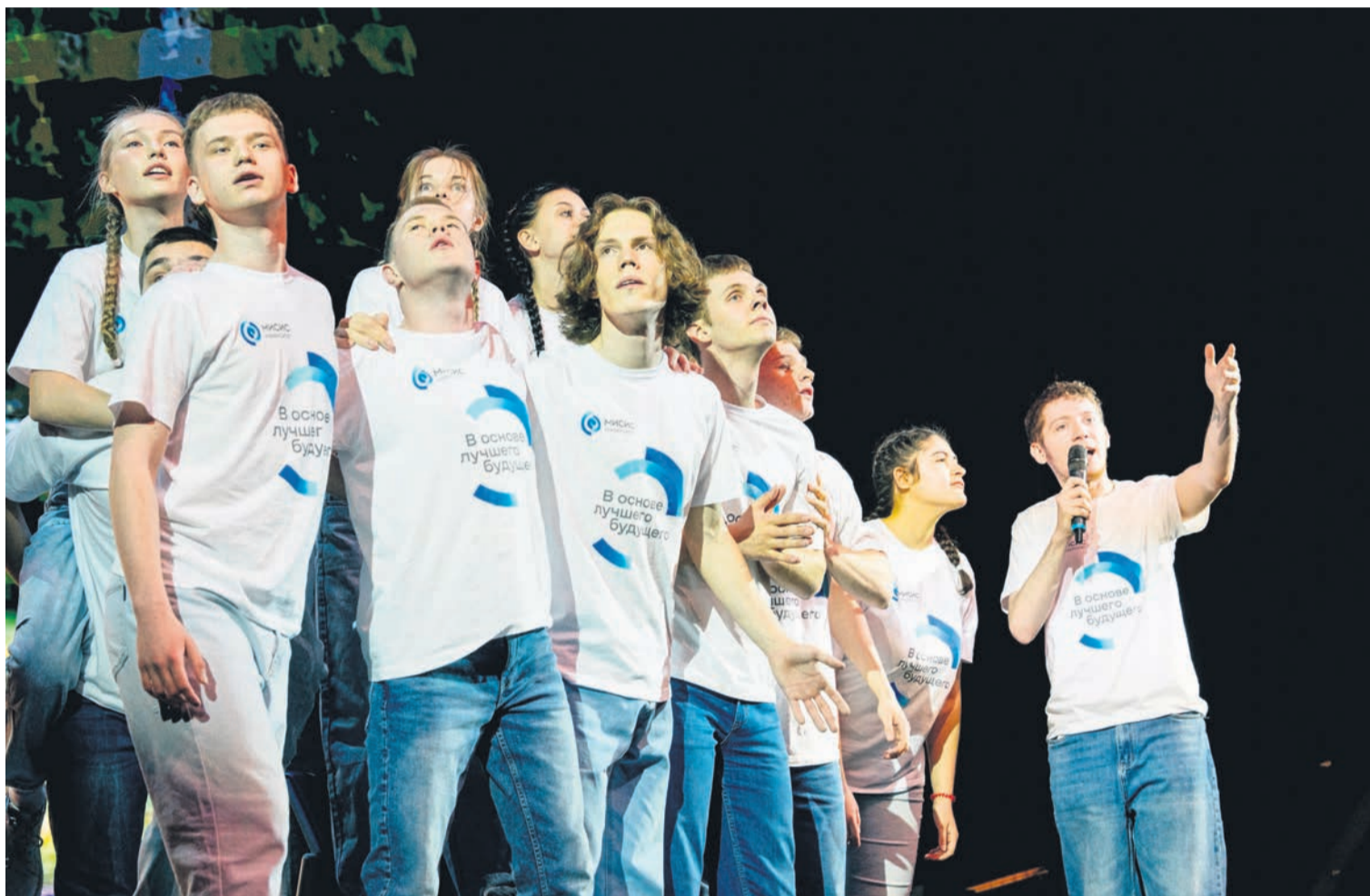
▲ В старом споре: кто важнее «физики» или «лирики», будущие инженеры из Новотроицка вновь доказали, что, кроме формул, им не чуждо и творческое начало