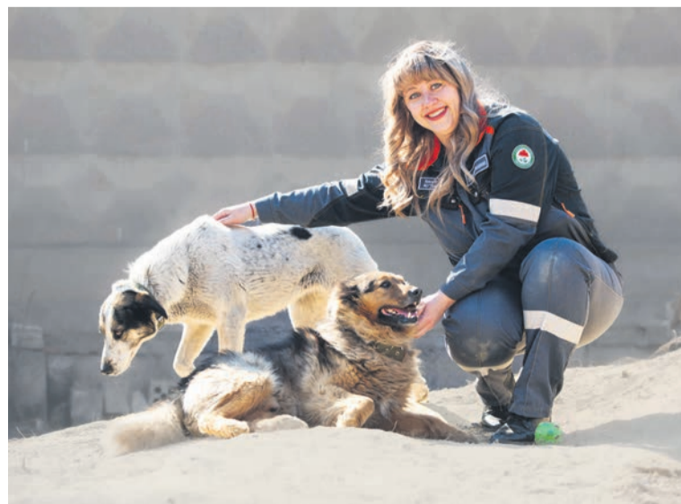
▲ Даже у равнодушных людей в душе есть место теплу и эмпатии к животным, хотя тех, у кого отзывчивое сердце точно больше