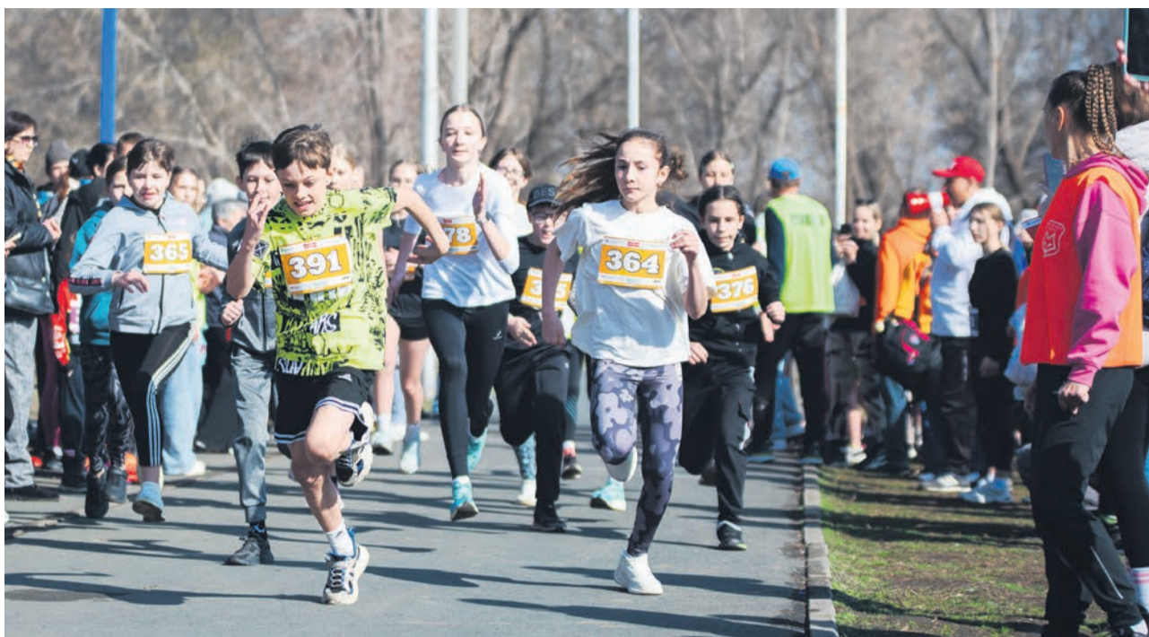
▲ Школьникам и подросткам традиционно отмеряют небольшие дистанции, учитывая, что для многих такие соревнования только первое прикосновение к миру большого спорта