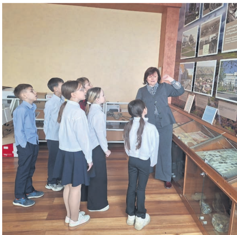
▲ Память о выдающемся геологе и основателе трёх городов, кроме городского музея, хранит и просветительский проект политехнического колледжа