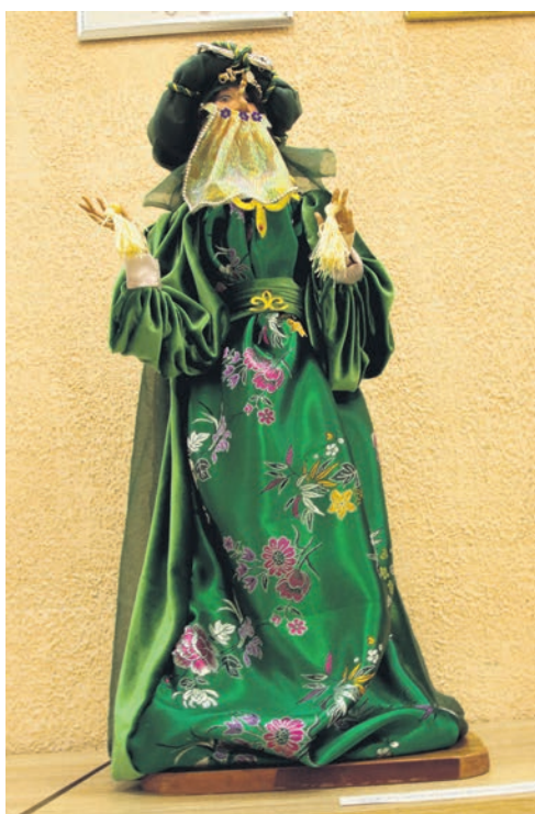
▲ Эта восточная красавица по обычаю тех краёв скрыла лицо от нескромных взглядов за газовой накидкой