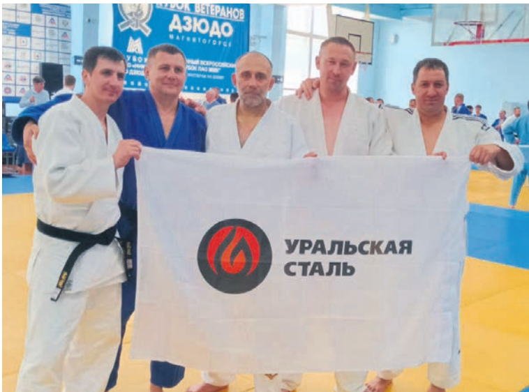
▲ Уже не первый год флаг Уральской Стали — непременный талисман спортсменов из Новотроицка, которые не возвращаются из Магнитки без наград

Всероссийский турнир по дзюдо среди ветеранов проходит в Магнитогорске с 1996 года, наши соседи стали проводить такие состязания первыми в России. И сегодня это один из самых значимых турниров, на который приезжают сильнее борцы-ветераны.