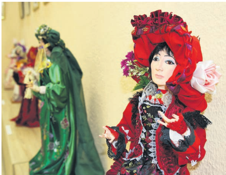
▲ Время работы над игрушкой зависит от сложности придуманного костюма и может составлять от пары месяцев до полугода