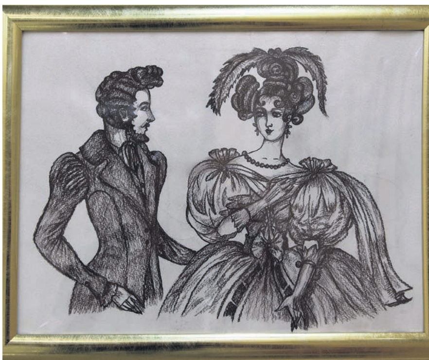
▲ Возможно, к следующей выставке Пугачёва отдаст должное и мужскому костюму, словно намекает нам этот набросок