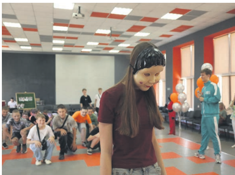
▲ Обмануть Куклу-охранника, когда под маской прячется настоящий человек, выходило только у тех, кто шёл к победе очень маленькими шагами

Сбор ребят начался в коворкинг-центре, празднично украшенный зал которого ясно говорил: формулам и химическим опытам придётся подождать сентября. В зале гостей приветливо встречали ростовые куклы-металлурги, чтобы угостить всех желающих сахарной ватой. А когда среди юных инженеров стали возникать герои нашумевшего сериала «Игра в кальмара», школьники одобрительно загудели, поняв — скучно точно не будет. Ученики поделились на две команды (мужскую и женскую) и приступили к заданиям, где главным было не хорошее знание математики или химии, а смекалка, сила, внимательность и находчивость.