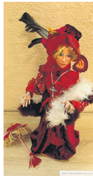
▲ Этих кукол язык уже не повернётся назвать игрушками, настолько ценна в них каждая деталь вручную пошитого гардероба