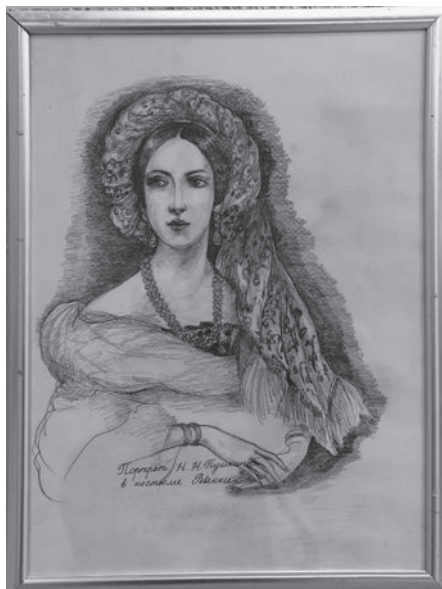
▲ Для эскиза костюма Ревекки Дине Пугачёвры приглянулся портрет Натали Пушкиной