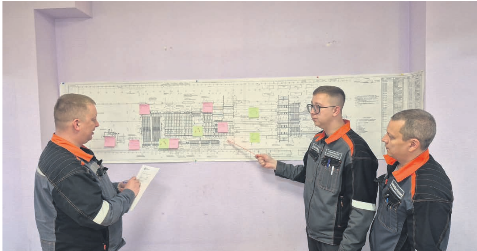
▲ Масштабы производства на Уральской Стали велики: только схема КПСЦ для ЛППЦ-1 занимает целую стену в офисе дирекции по развитию бизнес-системы комбината

Карта потока создания Ценности помогает выявить восемь видов потерь, устранение которых создаёт потенциал для улучшения, и задача эксперта — найти и превратить их из потенциала в неотъемлемую часть производства. Для этого у него уже есть карта всех процессов, которая делает картину прозрачной для специалиста, позволяя в деталях разглядеть, как работает система. Остаётся