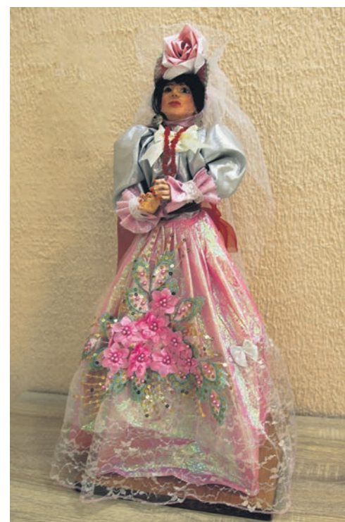
▲ Встретить такую красавицу на балу и не пригласить её на тур мазурки вряд ли возможно