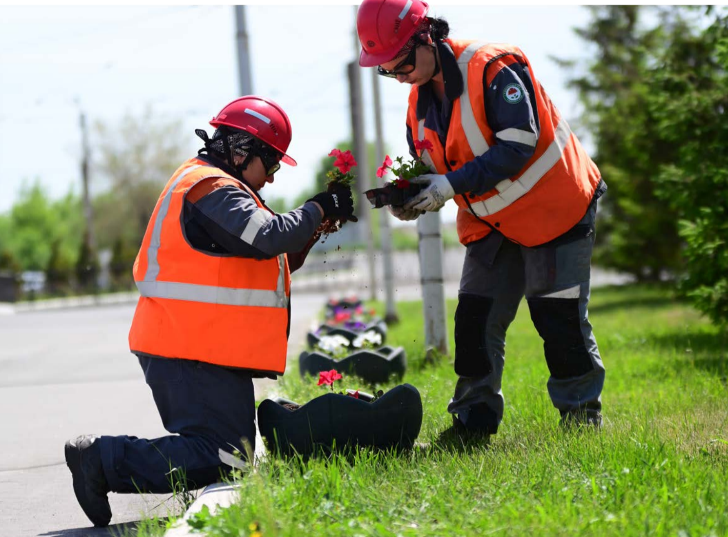
▲ В этом году озеленители ремонтно-механического управления высадят на территории Уральской Стали свыше трёх тысяч единиц однолетних и многолетних растений