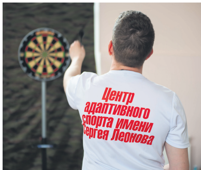
◀ Большинство соревновательных дисциплин адаптированы для тех, у кого есть физические ограничения, а единственным исключением стал дартс