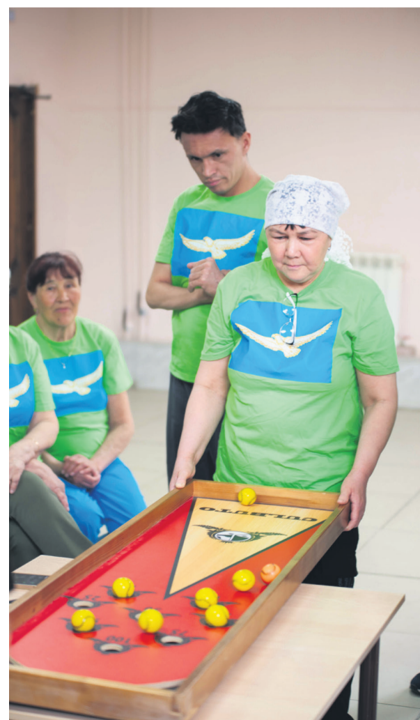
▲ Кульбудо позволяет игроку тренировать моторику, координируя траектории свободно катящихся по игровому полю мячей