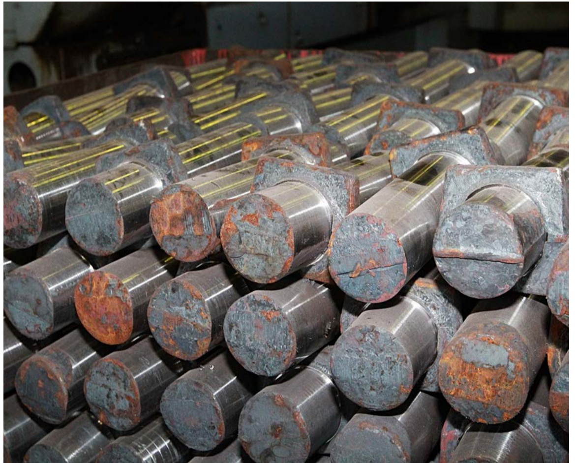
▲ Крупносерийное производство запчастей оправдано, когда оно не омертвляет капитал, неделями ожидая отправки со склада заказчиком в цехах

Брак — самая «дорогая» потеря, потому что она превращает материал, энергию и время в продукт, не несущий ценности. В металлургии дефект —