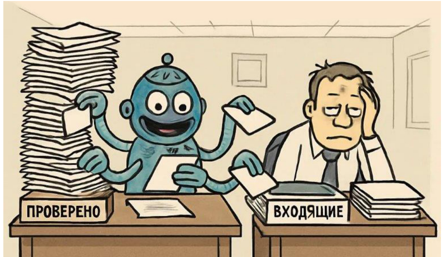
▲ Человечество неотвратимо идёт к технологическому укладу, в котором всё, что можно представить в виде алгоритмов, будут делать компьютеры

— Очень полезная доработка для платформы: теперь промпты можно собирать из готовых блоков и исполь-