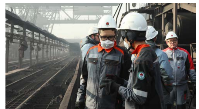
▲ В ходе изучения оборудования домны студенты НФ НИТУ МИСИС получили сведения, которые помогут им уточнить придуманную концепцию

технических решений. Кульминацией станет июньская защита проекта перед авторитетной комиссией. И кто знает, возможно, идея, рожденная в стенах института и отточенная в диалоге с практиками, скоро воплотится в жизнь и поможет сделать производство на Уральской Стали ещё эффективнее.