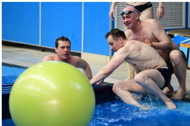
▲ «Плот сдал!» — «Плот принял!», даже в самой длинной эстафете исход порой определяют считанные секунды