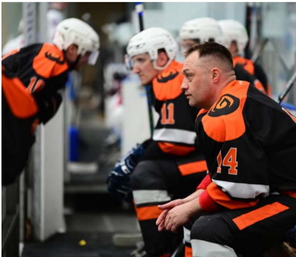
▲ После провального второго периода «Уральская Сталь» не стала уходить в раздевалку — игроки размышляли о причинах проигрыша в одиночку или в беседе с партнёрами

Несмотря на то, что теперь у команды «ГДО» 16 очков, она не смогла потеснить «Уральскую Сталь» со второго места. На звание чемпионов области, кроме металлургов и «ГазпромДобычи» претендует и команда Оренбургского газоперерабатывающего завода, у которой без учёта результатов последнего тура 18 очков и первое место в таблице.