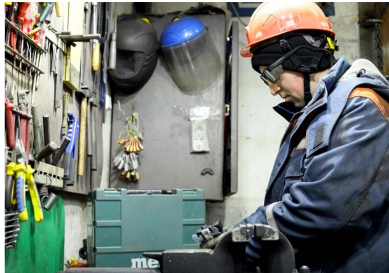
▲ Итоги ПС прошлого года показали: в части подразделений существуют разночтения в применении 5С-методик, одна из задач на этот год — унификация подходов

Стремление быть лучшим — нормально, публичное призна-