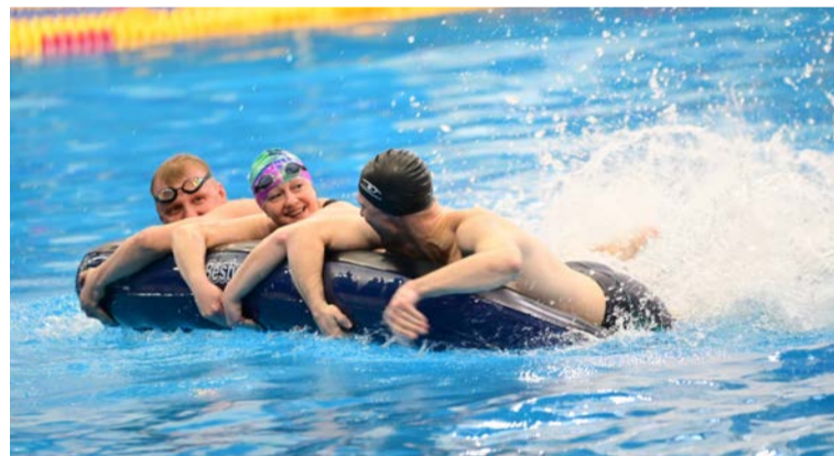
▲ Опытным путём команды выяснили, что руки в этом конкурсе не добавляют скорости импровизированному судну