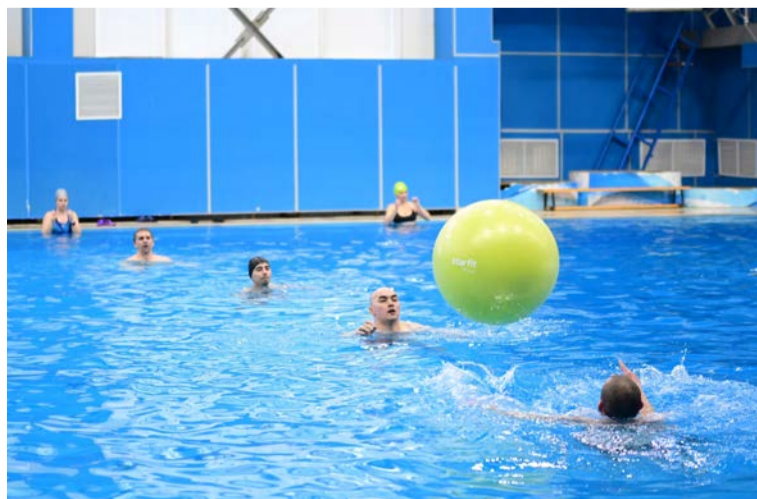
▲ Глубина бассейна в этом месте больше двух метров, так что бросать мяч игрокам приходилось, не имея опоры под ногами