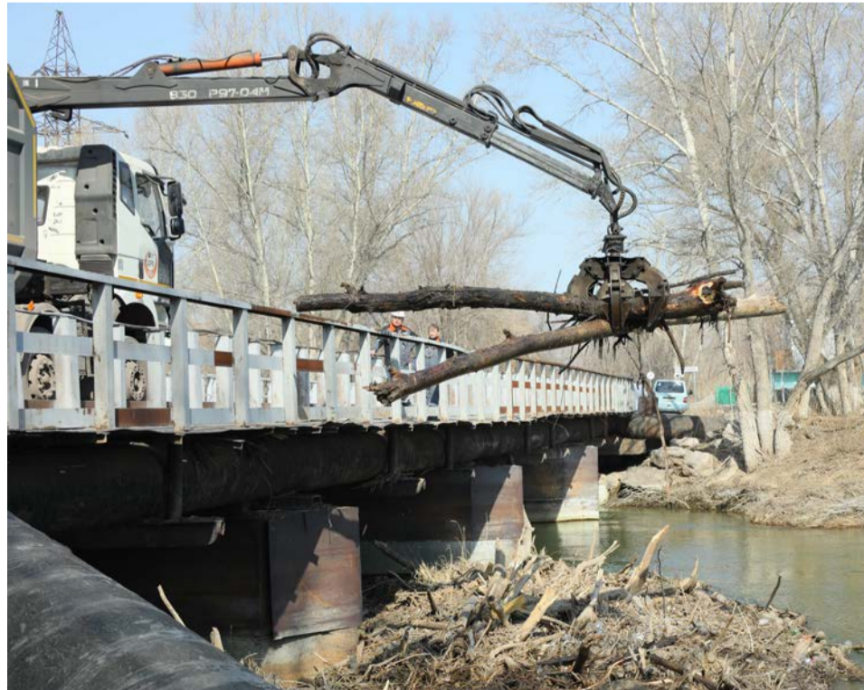
▲ Помня, каких бед наделал паводок два года назад, в этот раз металлурги не дали ни шанса стихии повторить испытания людей на прочность

Работники службы благоустройства ремонтно-механического управления Уральской Стали избавляли оба моста от нерукотворного затора. Принесённые водой деревья и мусор сложил себе в кузов грузовик, оснащённый грейферным краном-манипулятором с многопальным, как спрут, захватом. Слишком длинные стволы и слишком разлапистые коряги металлурги распилили бензопилами. Работа спорилась, доказав: всё на Уральской Стали — и люди, и техника — готовы к многодневному марафону по уборке города.