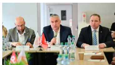
▲ Комбинат всегда участвовал в развитии горда и сейчас не стоит в стороне

В ходе беседы стороны обсудили вопросы доступности узких специалистов, организацию круглосуточной работы травмпункта, закупки медоборудования и лекарств, а также льготы молодым медикам.