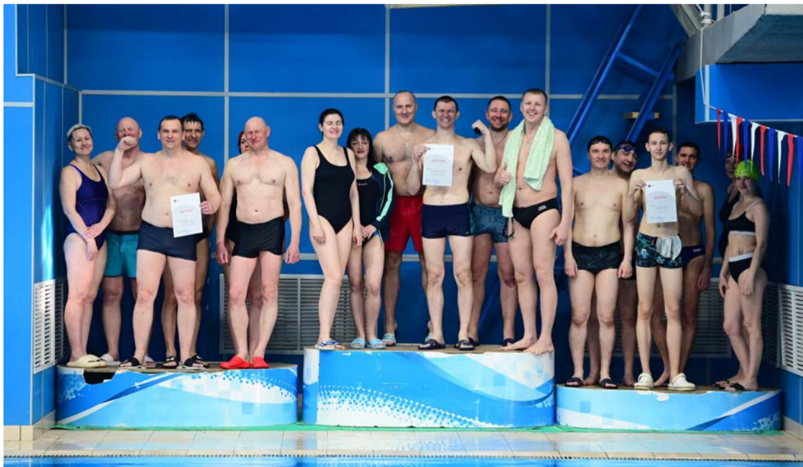
▲ «Стальная акватория» вновь удалась на славу, даже те, кто не выиграл подиума, сердечно поздравили коллег, которым в этот раз улыбнулась удача