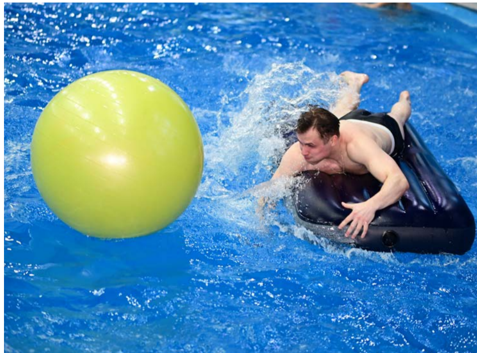
▲ Один неловкий подбой и резиновый шар отлетает в сторону, приходится терять время на то, чтобы догнать его и вывести на нужную траекторию