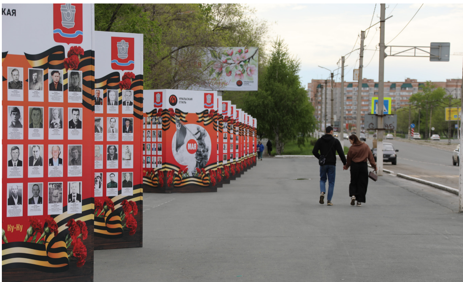
▲ Люди в Новотроицк, получивший статус города в 1945 году, съезжались со всей страны, поэтому стенды хранят память и о живших здесь героях, и о тех, кто никогда не бывал на Южном Урале