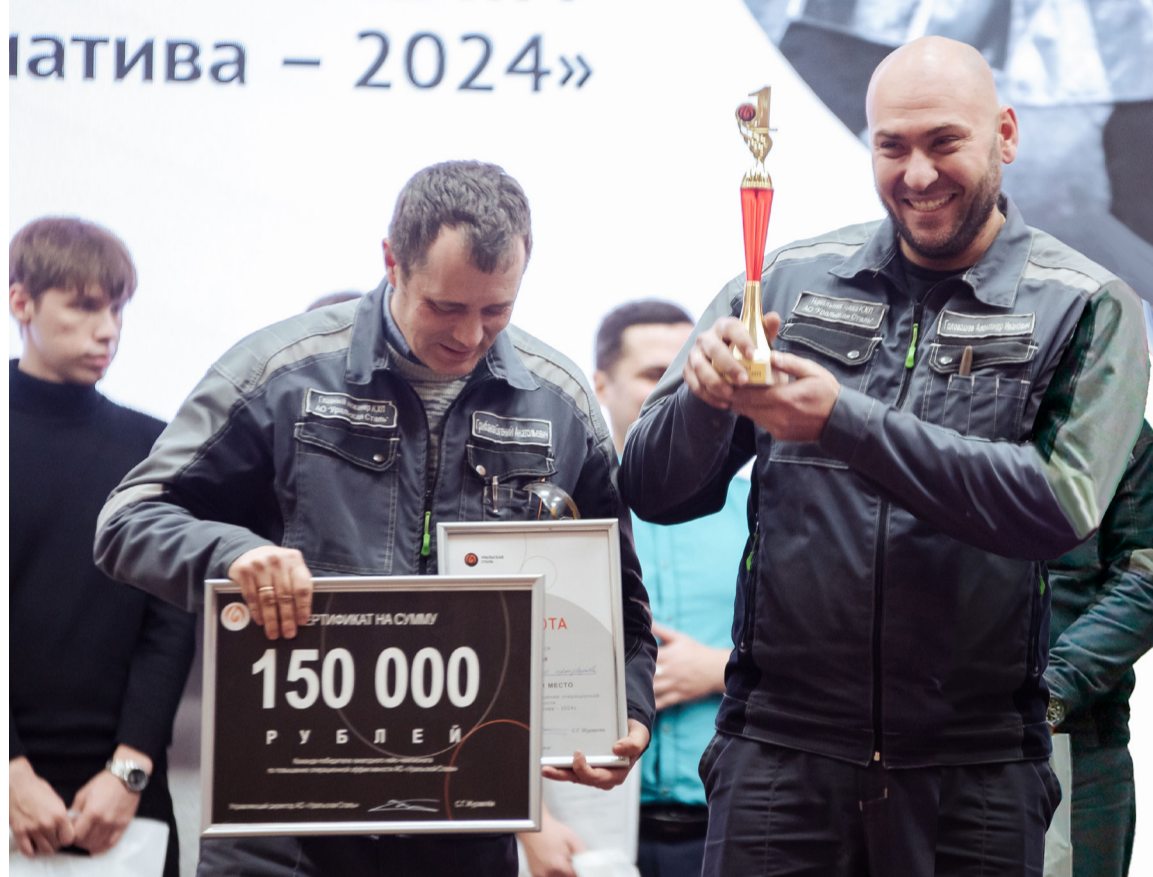
▲ В первом кейс-чемпионате победу одержали коксохимики, через год Гран-при забрала техническая дирекция, в конце 2026-го мы узнаем, смогут ли они повторить успех или поздравим нового победителя

✓ Вместе формировать «формулу экономии» Уральской Ста-