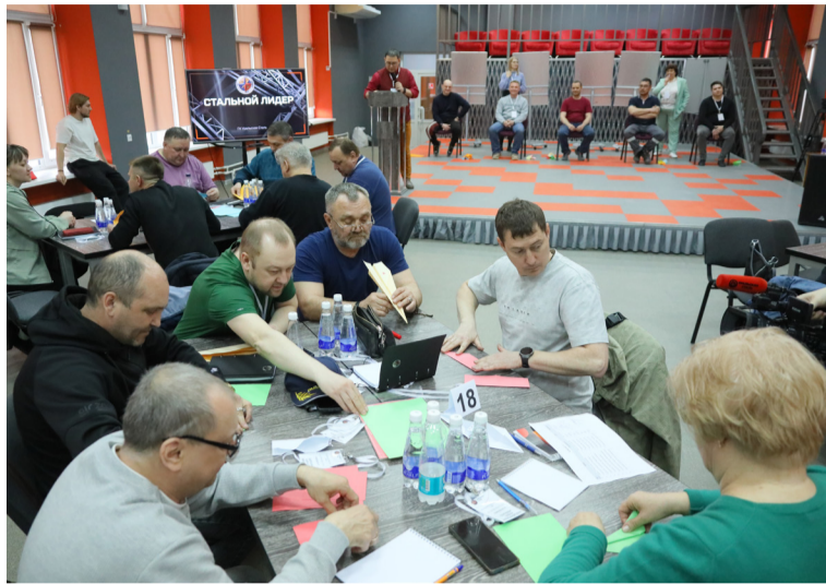
▲ Иногда обучение будущих Стальных лидеров проходит в режиме игры, где ответы знают лишь в жюри, а участникам нужно найти их наощупь

Новое мышление предлагает иначе. Команды задались вопросом: а что, если сам процесс ремонта — это технология, которую можно смоделировать эффективнее? Зачем греть огромную печь, расходуя энер-