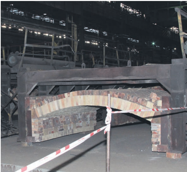
▲ Для удобства ремонта закалочную машину разбирают на отдельные секции, чтобы огнеупорщикам можно было работать, не мешая друг другу

Ремонтная кампания-2025 в первом листопрокатном цехе Уральской Стали завершилась капремонтом роликовой печи №4.