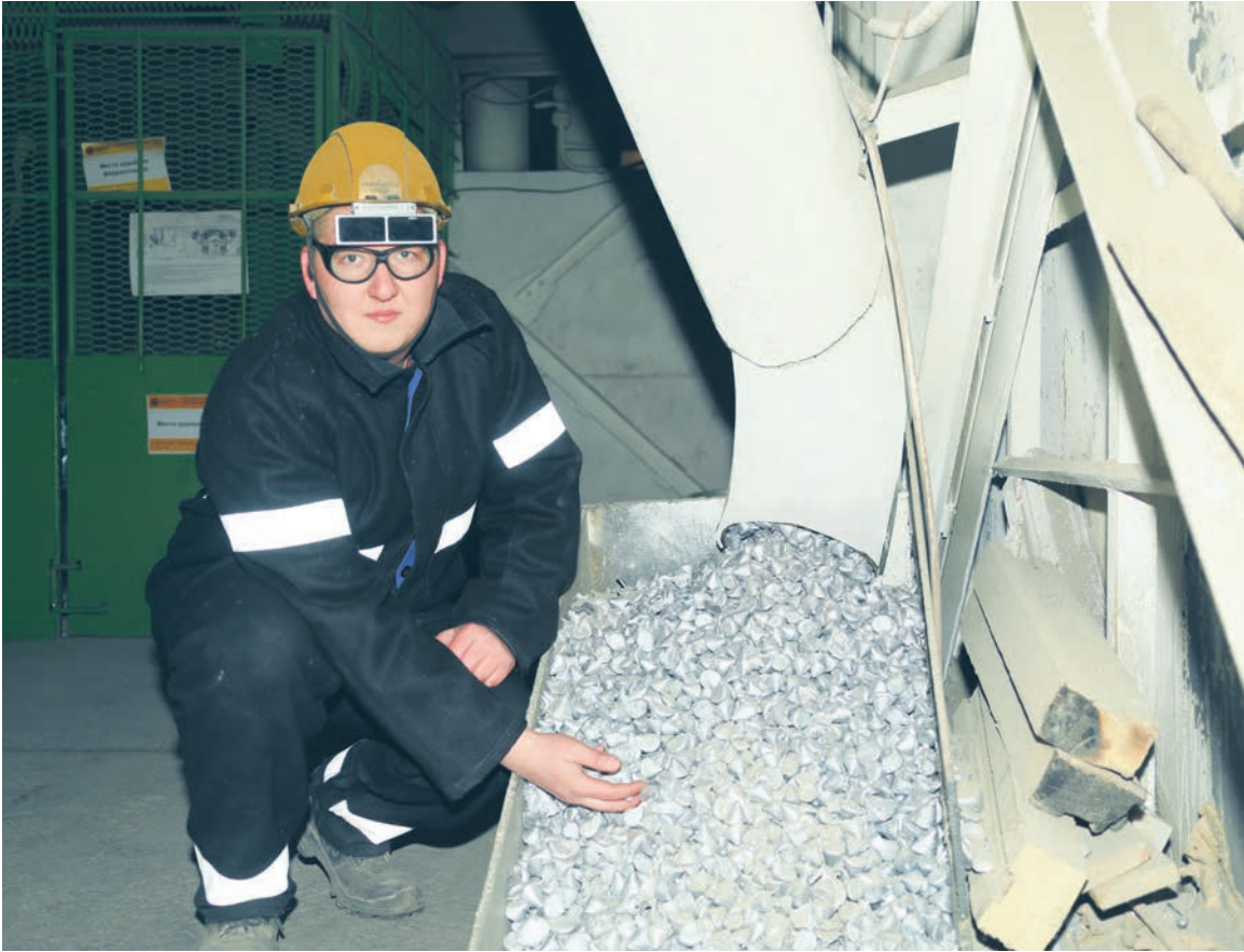
▲ Избежать потерь алюминия в ЭСПЦ теперь помогает бункер, из которого металл уходит по мере опустошения лотка — недорогое и рациональное решение

Второе место с 239 баллами занял копровый цех, чья сильная сторона — выполнение амбициозных целей по снижению затрат внутри комплексного показателя, что принесло им желанные 130 баллов. Также копровики отличились высокой интенсивностью в «Фабрике идей» (2-е место по коэффициенту интенсивности) и полным отсутствием нарушений дисциплины. Это пример подразделения, которое активно генерирует улучшения и строго следует внутренним правилам.