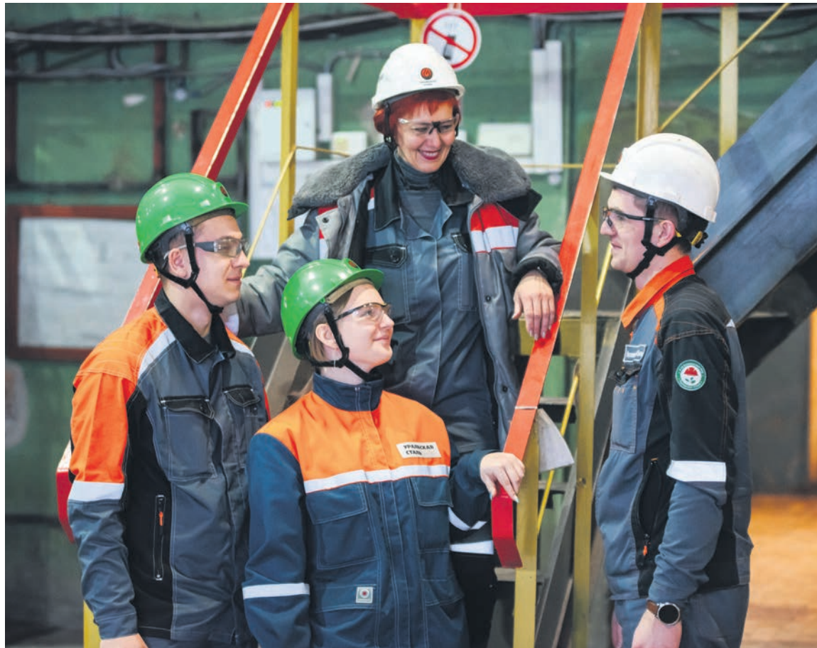
▲ Плох тот, солдат, который не мечтает стать генералом, говорил Суворов. А Уральская Сталь готова на большее — помочь действующим офицерам производства пройти годичное обучение в своей академии

— Нет, все сотрудники, вошедшие в целевую группу, получат приглашения заранее. Торжественный старт образовательного марафона запланирован на 4 февраля 2026 года, церемония пройдет в конференц-зале дома отдыха «Утёс». Перед будущими лидерами выступят вдохновители и наставники проекта: участникам детально расскажут о предстоящем обучении и пред-