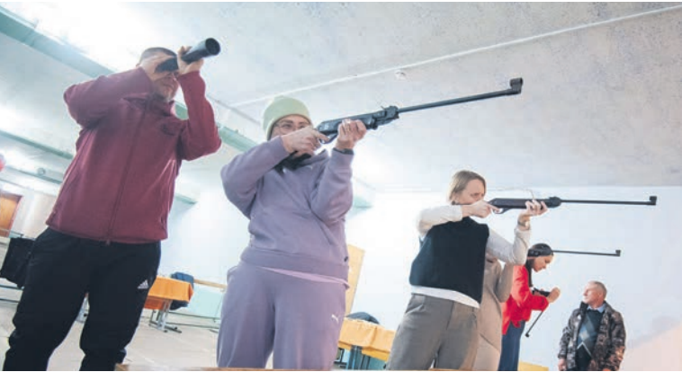
▲ Всё как на больших соревнованиях — после неточного выстрела ассистент может посоветовать поправить прицел для улучшения результата

В итоге на пьедестале почёта среди мужчин на первое и третье место поднялись две команды управления, пропустив на второе стрелков дирекции по транспорту. Их коллеги-женщины оказались более меткими, «настреляв» на золото, серебро у команды управления, бронзу поделили сборные ТЭЦ и УТК.