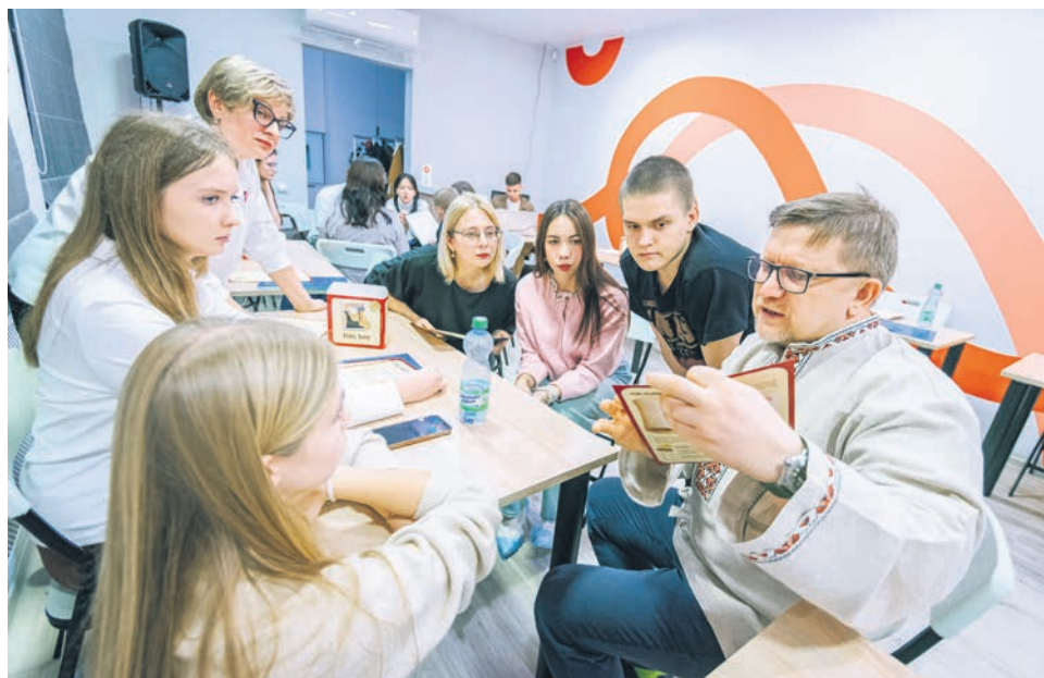
◀ Команда «Скоморохи» отвечала за музыкальную составляющую общественной жизни Новотроицка, успешно преодолевая сопротивление Лиха

Двухчасовую игру часть участников прожила в роли руководителей проектов, которые были вынуждены искать решения для непредвиденных сценарием ситуаций и активно коммуницировать с другими игроками. В финале каждая команда презентовала свой проект, несколько из которых со временем будут воплощены в жизнь.