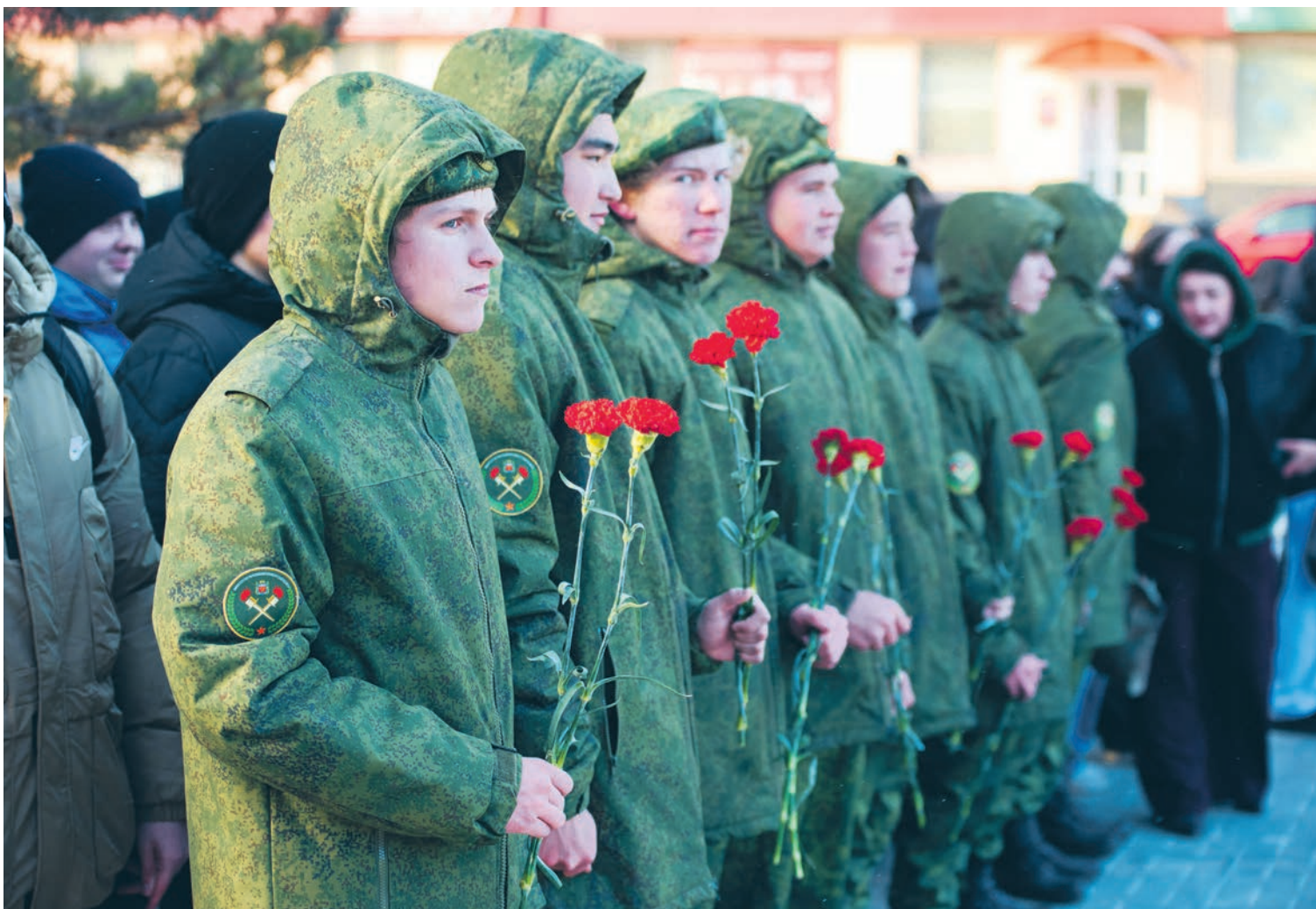
▲ Вместе с металлургами и ветеранами Уральской Стали в этот торжественный день на вахту памяти встали студенты и ученики новотроицких школ