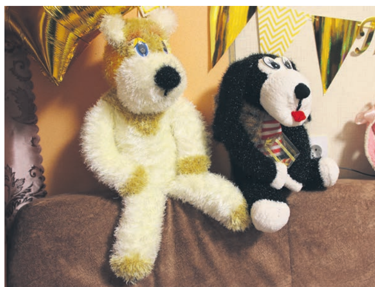
▲ Творческие опыты переходного периода — вязаные собаки, и они в несколько раз крупнее нынешних миниатюр