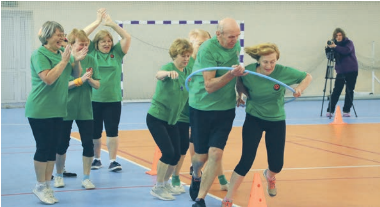
▲ В этом году «Чемпионы» вышли на площадку в статусе фаворитов и едва не уступили золото «Надежде», которая остановилась в шаге от победы

Состязания ветеранов всегда больше, чем спорт. Это напоминание, что активная жизнь не заканчивается с выходом на пенсию. Дважды в год комбинат проводит для них спортивные праздники (не считая занятий в группах здоровья). А 23 декабря ветераны съедутся в «Родник», чтобы на свежем воздухе сыграть в футбол и, если позволит погода, пройтись по зимнему лесу на лыжах.