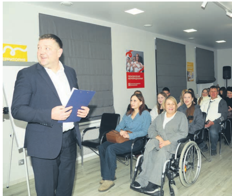
▲ «Академия грантов 2.0» поможет соискателям попробовать силы в «Хороших делах», а полученный опыт позволит не останавливаться на достигнутом

Обучение этого года подошло к концу, впрочем, у участников ещё много работы: им предстоит тщательная шлифовка грантовых заявок перед их подачей на финансирование.