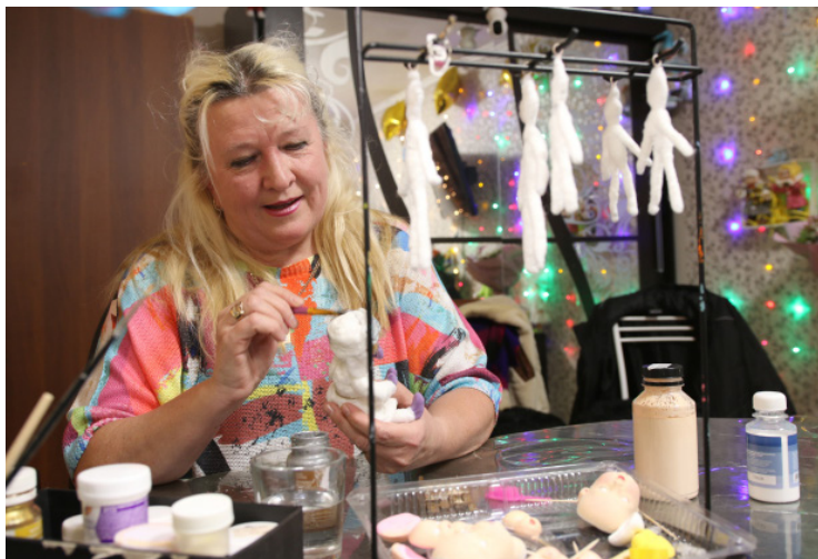
▲ Краски, кисть плюс фантазия автора — и игрушка начинает оживать в её руках, получая свой неповторимый характер